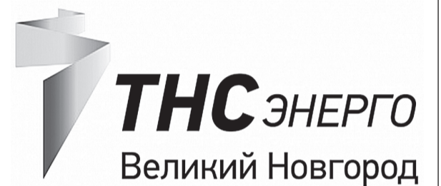
График выезда мобильных офисов ООО «ТНС энерго Великий Новгород» на июнь 2019 года

Голосование проходит на сайте http://n-west.ru/ja-grazhdanin-rossii-2019/#vote-4 . Справа от фамилии участника размещена конкурсная работа.