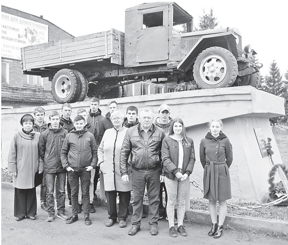
Участники школы «Экстрим» у памятника военным автомобилистам